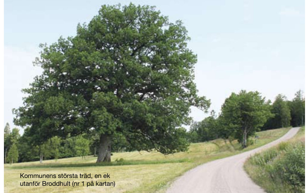
Kommunens största träd, en ek utanför Broddhult (nr 1 på kartan)

Välkommen att besöka 15 av Gnosjö kommuns "jätteträd" - karta med träden utmärkta, skyltar vid varje träd med information. Ta gärna cykeln när du besöker dessa träd!